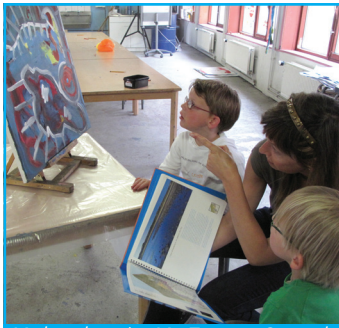
Medewerkers in Mu-Zee-um Oostende gebruiken de kustatlas bij hun cultureel-educatieve activiteiten.

Verschillende gebruikers en sectoren vinden hun gading in de kustatlas. De kustatlas zal zeker de kustliefhebber, scholieren, wetenschappers, leerkrachten, de kustgebonden en maritieme bedrijfswereld, culturele instellingen, besturen en geïnteresseerden weten te bekoren. Naast een